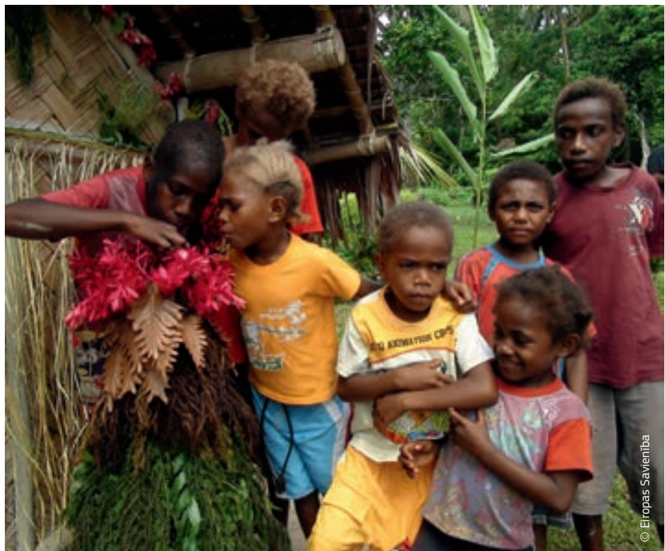
Vanuatu bērni veido Garata kalna vulkāna modeli — šis vulkāns visvairāk apdraud viņu dzīvību.

Eiropas Komisijas pieeja, kurā galvenais uzsvars likts uz izturētspēju, izglābs vairāk dzīvību, ļaus ietaupīt līdzekļus un palīdzēs izskaust nabadzību, šādi vairojot atbalsta pozitīvo ietekmi un sekmējot ilgtspējīgu attīstību.