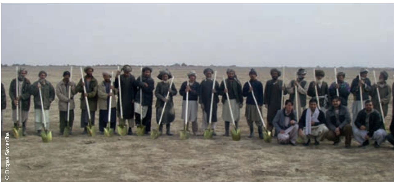
Pēc sausuma, kas skāra Afganistānu, izraisot badu un piespiežot daudzus iedzīvotājus pamest mājas, afgāņi ir saņēmuši darbarīkus ECHO finansētā programmā.

2007. gadā ES iestādes un 27 dalībvalstis vienotās par politikas pamatdokumentu "Eiropas konsenss par humāno palīdzību". Tajā tika uzsvērts, ka ES humānā palīdzība nav politisks instruments, un vēlreiz tika apstiprināti humānās palīdzības galvenie