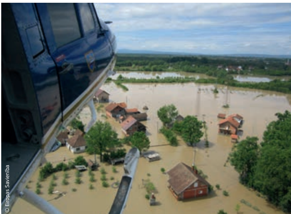
Piedaloties ES Civilās aizsardzības mehānismā, Slovēnijas helikopters sniedz ārkārtas palīdzību plūdos cietušajiem Bosnijā un Hercegovinā.

Papildus palīdzībai, ko ES dalībvalstis nodrošināja, iedarbinot ES civilās aizsardzības mehānismu, ES arī piešķīra trīs miljonus eiro humānajai palīdzībai, lai atbalstītu abu valstu visneaizsargātākos iedzīvotājus. Šo humāno palīdzību saņēma pusmiljons cilvēku. Taču abām valstīm priekšā vēl stāvēja plaši atjaunošanas un rekonstrukcijas darbi.