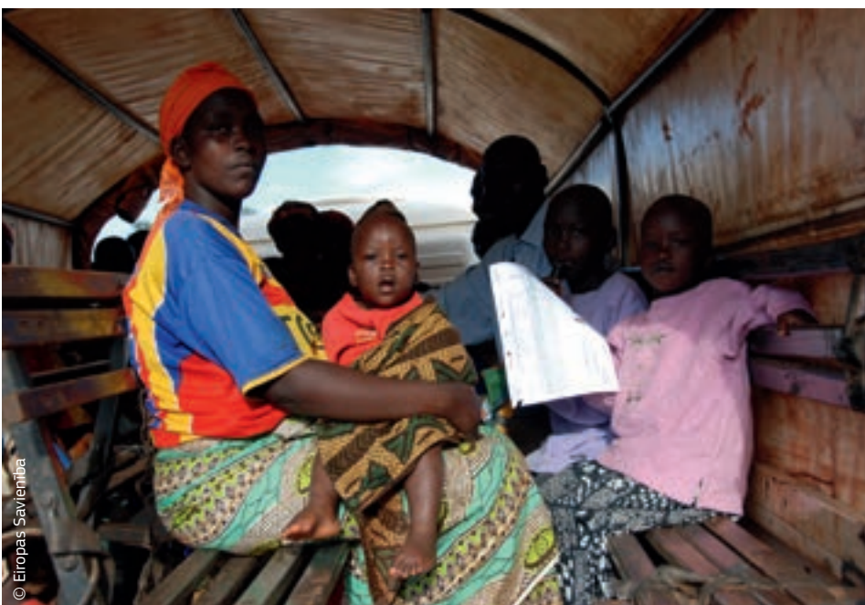
Šī Burundi ģimene, kas bija zaudējusi pajumti, varēja atgriezties mājās, pateicoties ES atgriešanās atbalstam.

Lai spētu risināt katastrofu ilgtermiņa ietekmi, gādātu par sagatavotību un sekmīgāk novērstu katastrofas veidošanos, ir nepieciešams, lai humāno palīdzību un reakciju krīzes situācijā papildinātu pasākumi citās jomās, kuras ietver attīstības sadarbību un vides aizsardzību. Tādēļ būtiska nozīme ir koordinācijai ES līmenī.