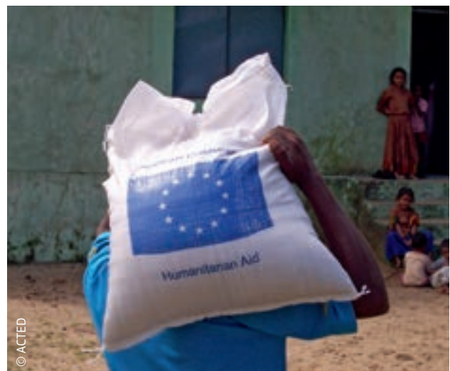
ES finansē humāno palīdzību Indijā kopš 1996. gada.

ES civilās aizsardzības mehānisms palīdz dalībvalstīm novērst katastrofas, sagatavoties ārkārtas situācijām un apvienot resursus, kurus tad var ātri un koordinēti nosūtīt uz katastrofas skartajām valstīm. ES humāno palīdzību piešķir ārpussavienības valstīm, bet šo mehānismu var aktivizēt ārkārtas situācijās, kas izcēlušās gan ES robežās, gan ārpus tām. ES civilās aizsardzības mehānisms ir instruments, kas